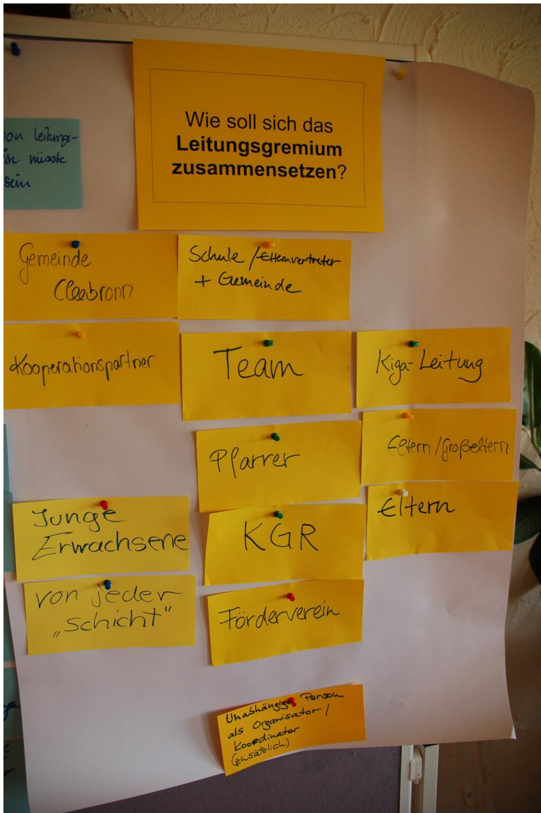
Im Anschluss wurde die Zusammensetzung in der Gesamtgruppe festgesetzt