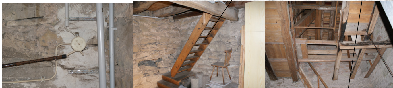
Erneuerung Elektroinstallation, Glockenböden sichern und schließen, Einhausung der Treppen über Turmgewölbe