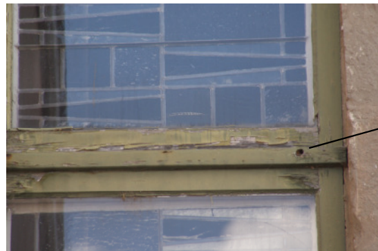
Sanierung Kirchendachtraufen und Kirchenfenster