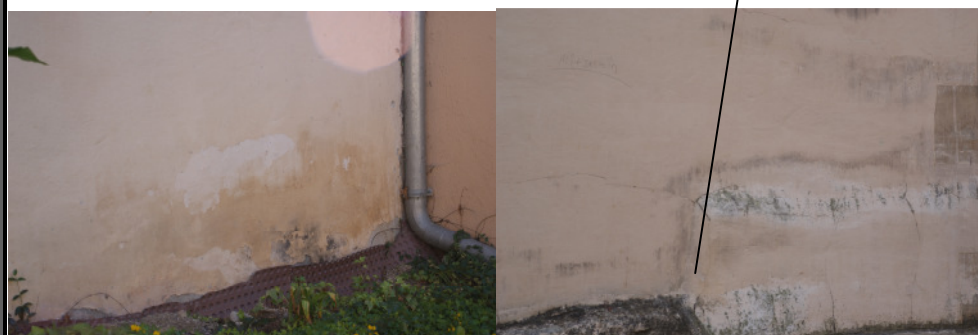
Sockel gegen Feuchtigkeit abdichten, Sockelputz entfernen und erneuern