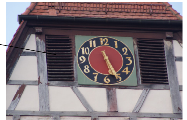
Fassade und Ziffernblatt renovieren, Schall-Läden erneuern, Taubenabwehr