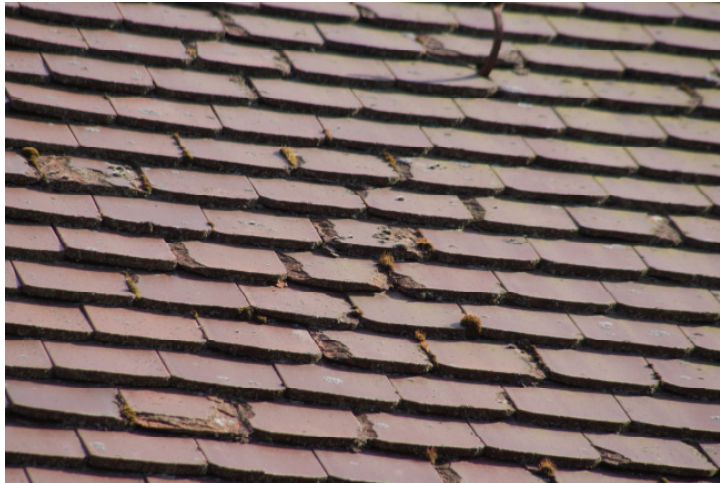
Kirchendach: Nord- und Südseite Ziegel erneuern und Wärmedämmung