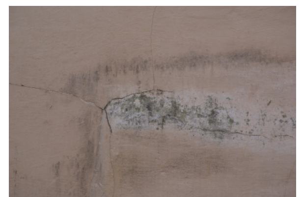
Putz sanieren, Fassade streichen