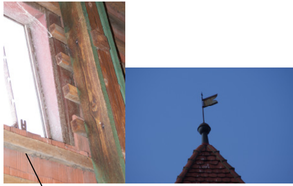
Dachfenster und Fahne erneuern